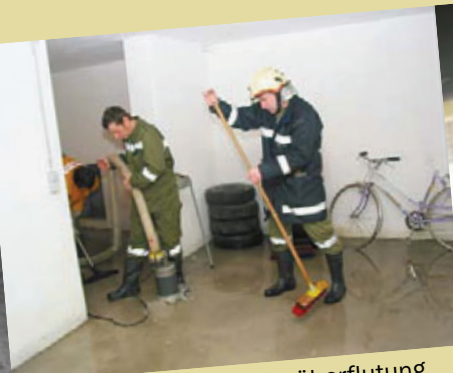
12. Februar 2005: Kellerüberflutung in der Sportplatzstraße