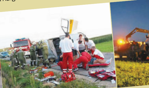
9. September 2005: Schwerer Verkehrsunfall Brünninger Bezirksstraße