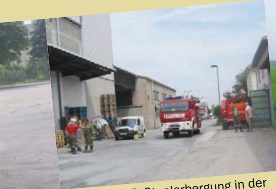
29. Juli 2005: Staplerbergung in der Bahnhofstraße

Dieser Überblick stellt selbstverständlich nur eine kleine Auswahl der insgesamt 98 Einsätze des Jahres 2005 dar, soll aber trotzdem einen Einblick geben in die vielfältigen Aufgaben der Feuerwehr Andorf.