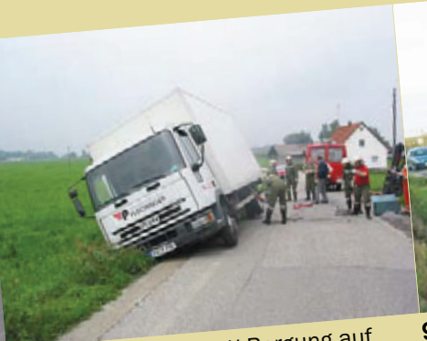
24. August 2005: LKW-Bergung auf der Kallinger Landesstraße