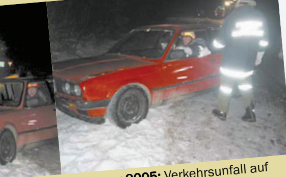
8. Februar 2005: Verkehrsunfall auf der B137