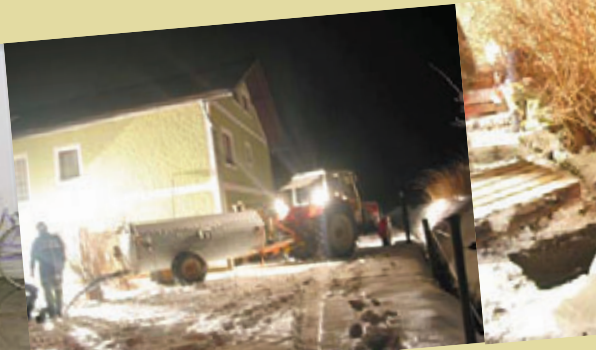
20. Februar 2005: Leichenbergung aus Senkgrube